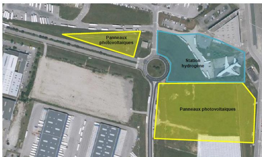
Figure 2 : Zones d'implantation du projet

Le site a été précédemment exploité pour des activités industrielles (gravières, sablières, extraction d'argile et de kaolin) et servait également de dépôt d'ordures et de vidanges, ce qui en fait un site potentiellement pollué.